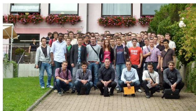
ITII Alsace - promotion Pierre Gangloff 2011-2014

296 apprenants sont actuellement à l'ITII Alsace (278 apprentis et 18 stagiaires en formation continue).