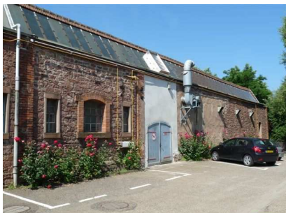
Centre de Reichshoffen