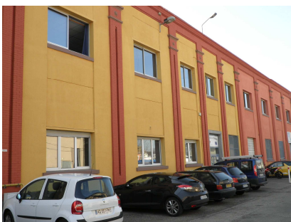
Centre de Colmar