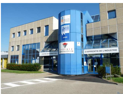
Centre de Strasbourg (Eckbolsheim)