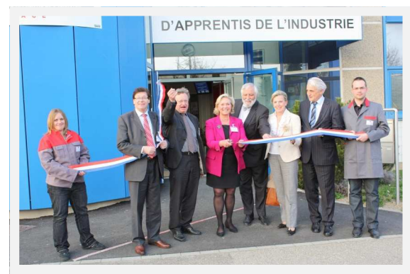
Inauguration du Pôle Métallurgie

Président de l'UIMM Alsace, Président de l'ITII Alsace Président de la Conférence des ITII