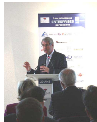
Philippe Richert Ministre chargé des Collectivités Territoriales, Président du Conseil Régional d'Alsace

« La Région Alsace et l'UIMM travaillent ensemble de façon efficace »