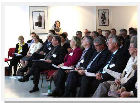
Un public convaincu par les résultats du CFAI Alsace

« On ne peut que se féliciter à la Communauté Urbaine de ce que vous faites au CFAI Alsace depuis 20 ans »